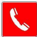
Telefono per interventi antincendio